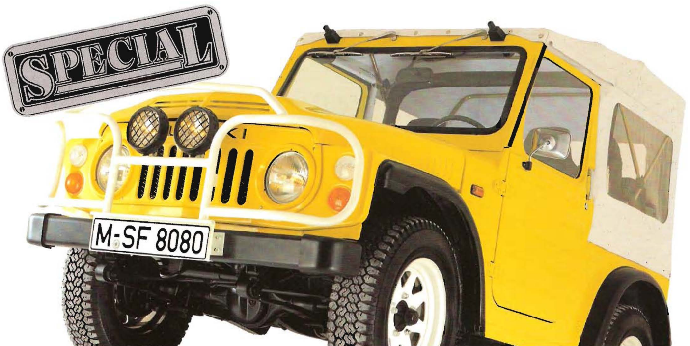
Abb.: Suzuki Special in der Ausstattungsvariante 2.